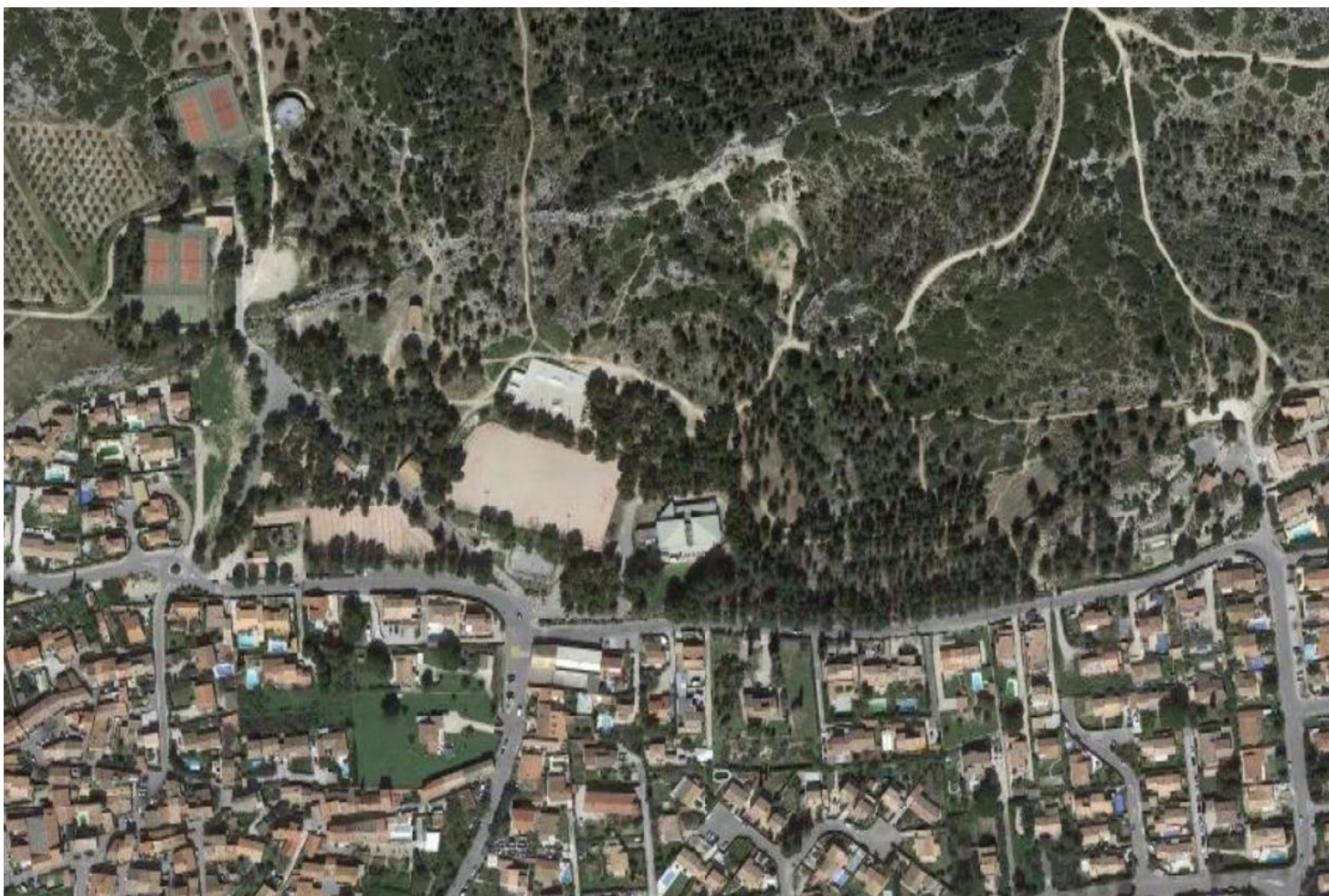
Vue aérienne du périmètre de l'OAP