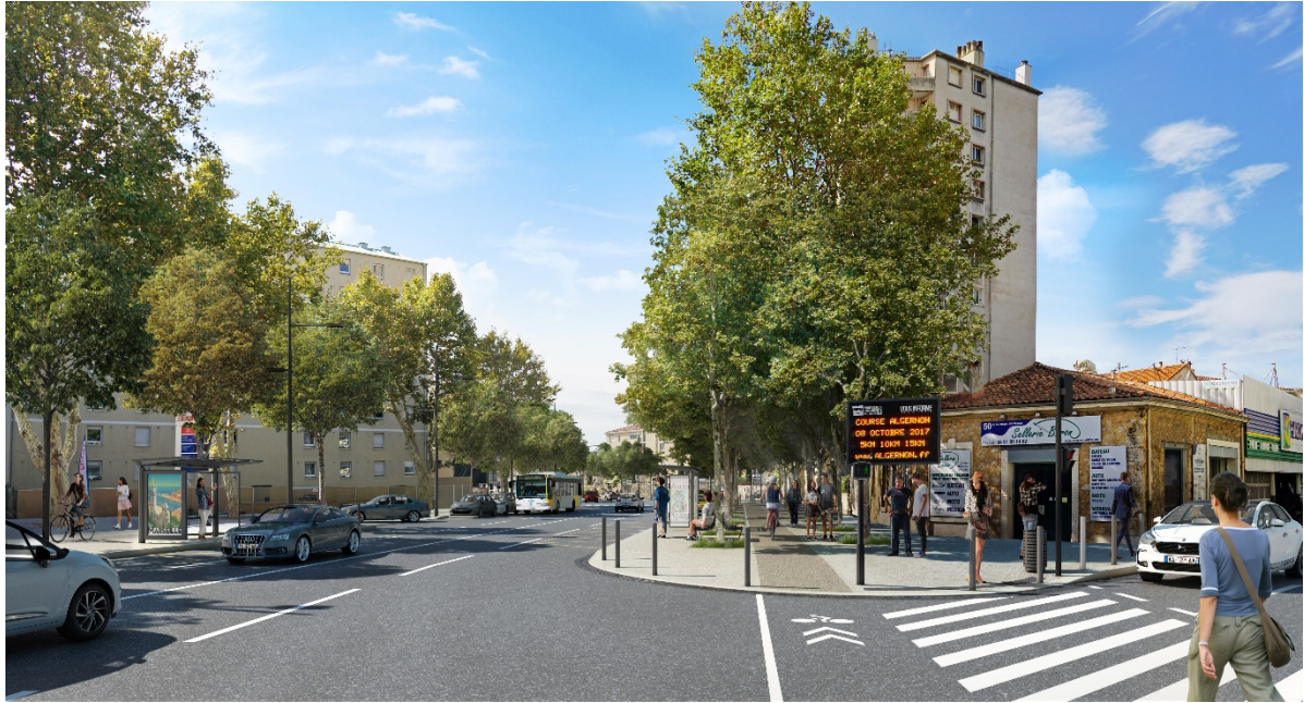
Légende : Réalisation des aménagements au carrefour boulevard Jean Moulin / rue Sainte-Baume (section 5)